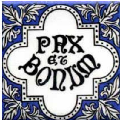
Franziskusfest am 4. Oktober